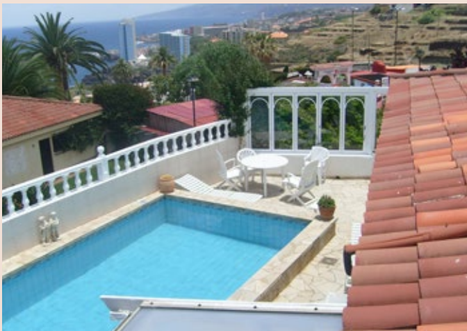
Ausblick Swimmingpool mit Sitzecke und Atlantik.

Der Transfer mit dem Leihwagen vom Flughafen Teneriffa Süd zum Ferienhaus fand somit tatsächlich im Dunkeln statt, aber unser Navi konnte sich auch bei Nacht gut zurecht finden. Etwas nach Mitternacht erreichten wir ‚unser Traumhaus‘ in Longuera bei Porto de la Cruz, Cala Hibisco Nr. 2. Diese Adresse solltet Ihr Euch merken, vielleicht steht Ihr eines Tages selbst vor dieser Tür!