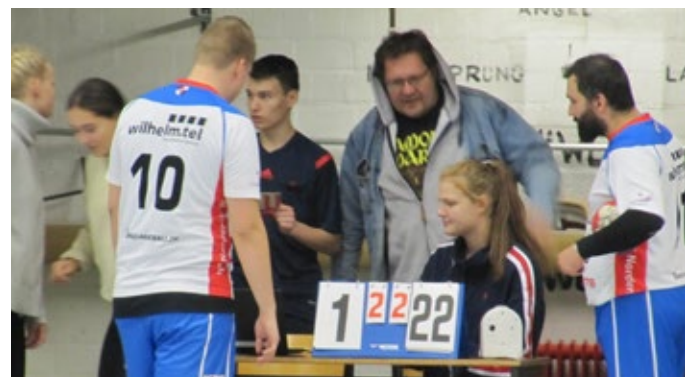
Kurz vor Spielende – Die Anzeige reichte nicht