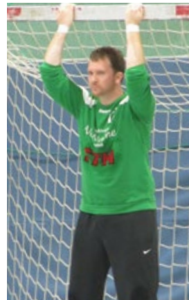
„Honk“ super gehalten, am Ende machtlos.