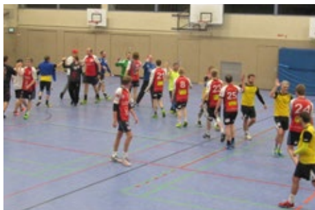
Abklatschen nach dem Spiel