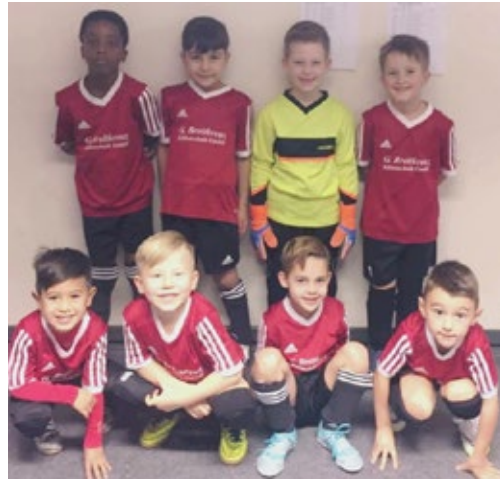
F-Jugend – Jahrgang 2012

Hervorzuheben sind aber ganz klar die guten Leistungen gegen Willinghusen/Oststeinbek und auch ganz besonders die knappe Niederlage gegen Vorwärts Wacker, die ansonsten alle ihre Spiele sehr deutlich gewonnen haben. Am Ende steht ein hervorragender 3. Platz von 6 Teams. Eine sehr gute Leistung aller Spieler.