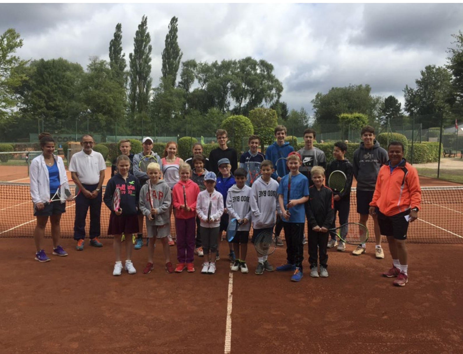
Die Teilnehmer am Tennis-Jugendcamp mit ihrem Trainer-Team.