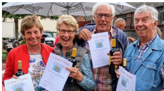
Die glücklichen Gewinner.

Bedingungen das Turnier durchziehen und anschließend das zubereitete Grillgut und weitere Drinks genießen.