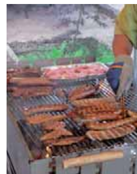
Da fällt die Auswahl schwer