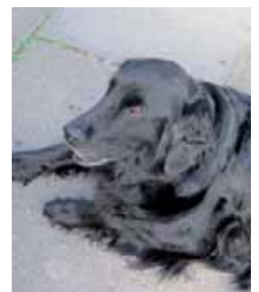
Anna: "Ob es 'ne Wurst gibt?"