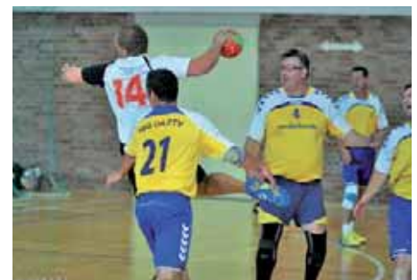
Torwurf des Gegners