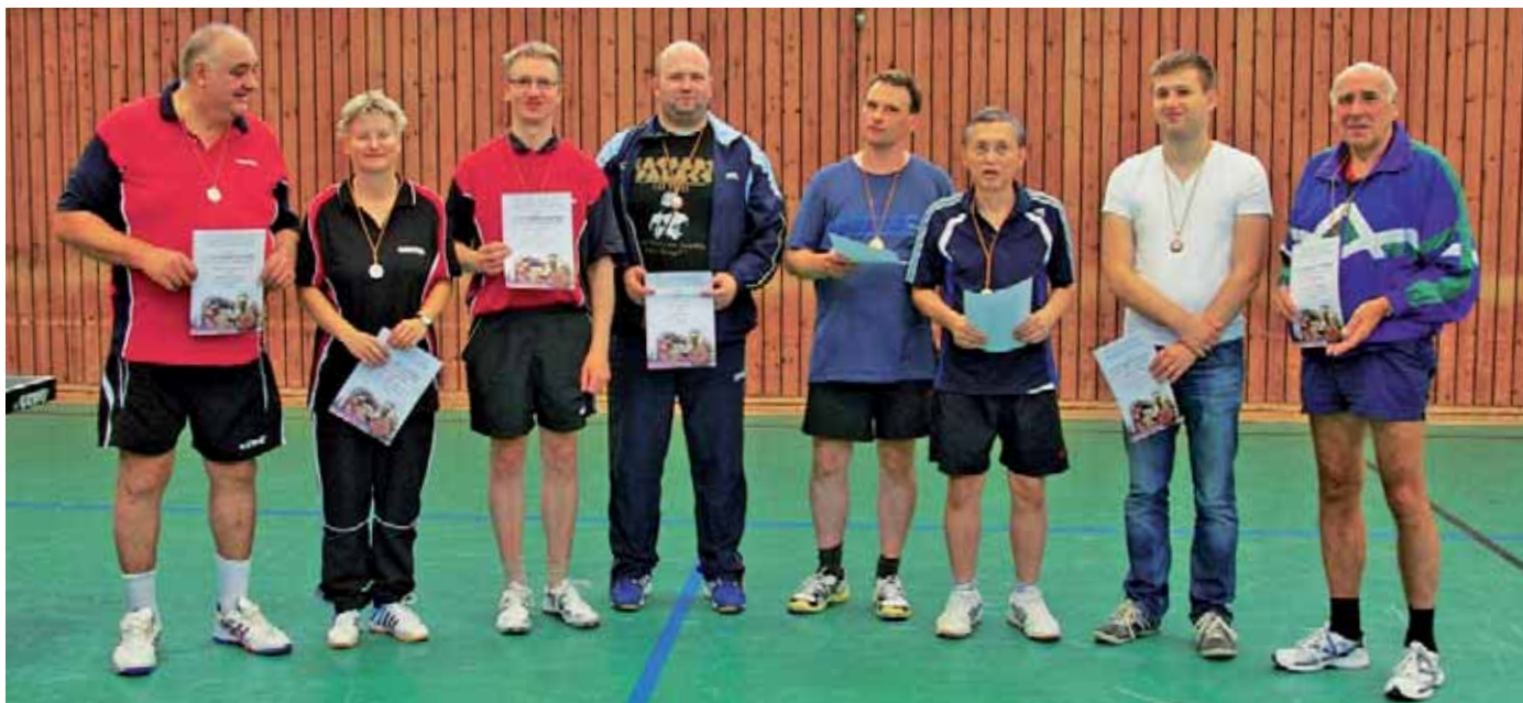
Die Sieger, Zweit- und Drittplatzierten des SG-Doppel-Sonntags