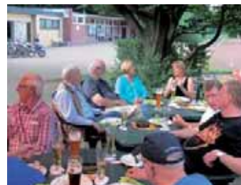
Plausch nach dem Essen