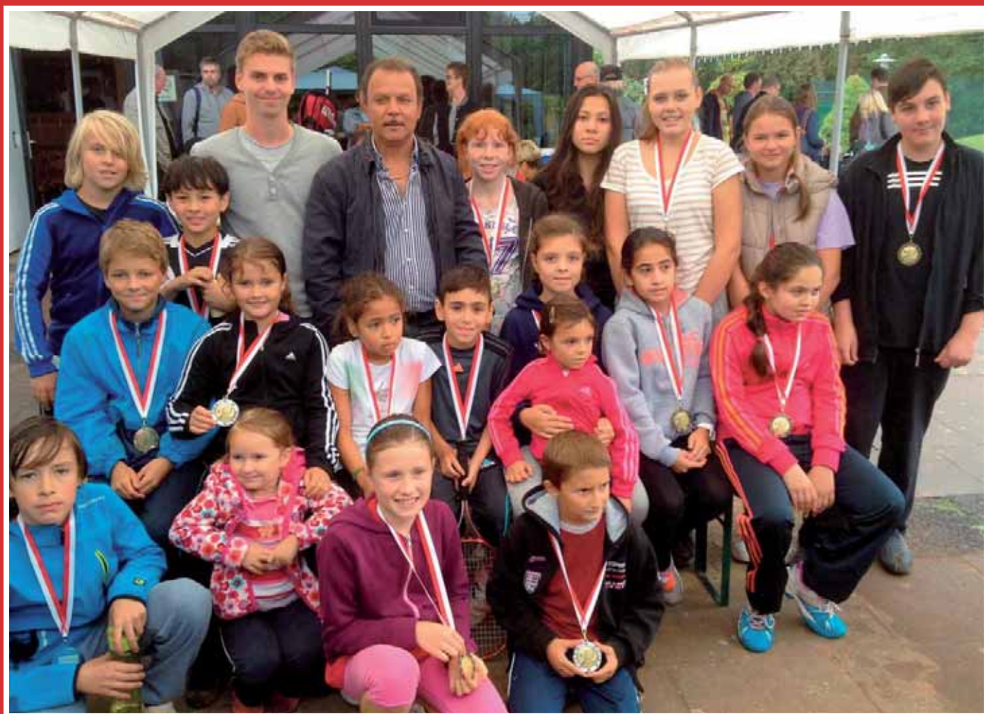
Tennis-Clubmeisterschaften: Kinder/Jugendliche (Siehe Artikel Seite 16)