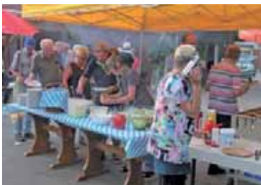
Erster Andrang der "Heißhungrigen"