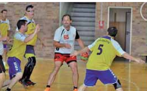
Abwehrarbeit von OA/FTV