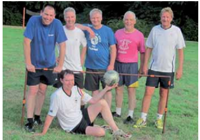
Kicken im Sommerloch