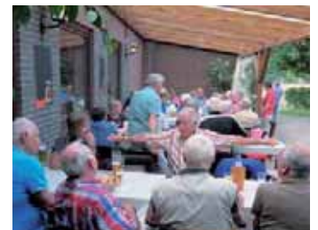
Erklärung mit vollem Körpereinsatz