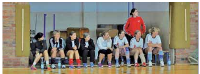
Die Frauen von OA/FTV (rechts)