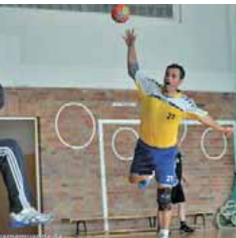
3M beim Torwurf